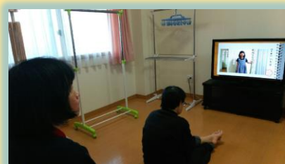
のんびりテレビタイム

グループホームは、利用者さんの生活する「住まい」なので自宅同様に、のんびりと自分の時間を過ごし、楽しく食事をとり、お風呂に入ってリラックス、よく眠り日々の疲れを癒す、といった当たり前の生活を送る事ができるよう、サービス提供しています。その中で、利用者さん一人ひとりの障がい特性に向き合い、「できる事は自分でやる」「新たな事に挑戦する」などの目標を定め、スタッフはその実現に向けてお手伝いをさせて頂いています。