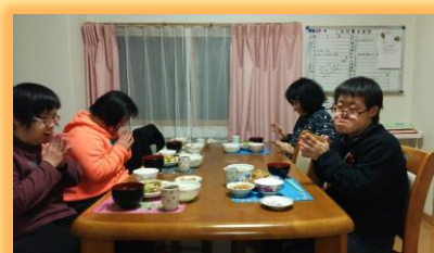
いただきますぁ～す！

その他事業として、グループホームとは別に、「しらすぎホーム」内にて短期入所事業（ショートステイ 定員 2 名）も運営しています。ご家庭の都合等で宿泊を希望される利用者さんが、短期間入居されています。