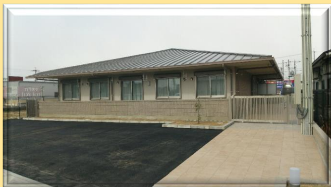
ホーム V6 が開所しました！

「ホーム V6」は平成 28 年度 3 月より運営を開始しました。新たに 6 名の利用者さんが入居され、期待と不安でドキドキの新生活をスタートさせています。